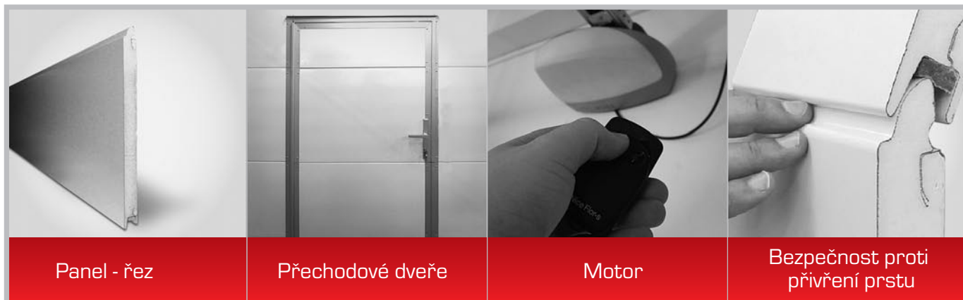
Panel - řez

Barevná kolekce panelů nabízí 4 odstíny dle RAL a 18 dekorů imitace dřeva. Panely nabízíme v 5 různých vzorech .